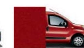
163 Rojo Oscuro