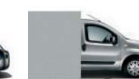
612 Gris Claro