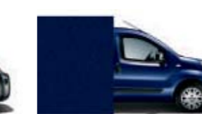
487 Azul Oscuro