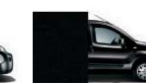
632 Gris Oscuro