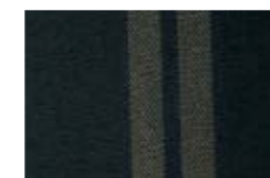
230 Autostrada negro/beige